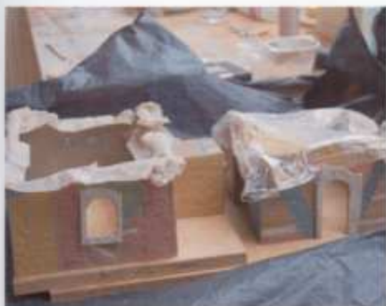
11. De gedeelten waar ik later nog platen op wil monteren, houd ik vochtig met wc-papier – en met plastic als ik het werk wat langer wil wegzetten.