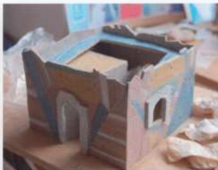
12. Bij het bouwen ondersteun ik het werk om vervorming te voorkomen.