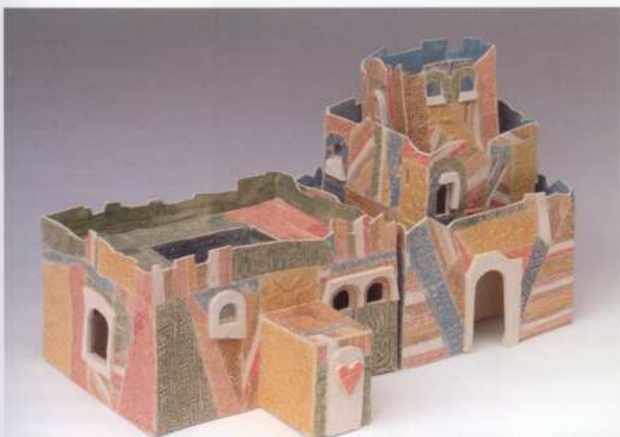
Het eindresultaat: My home is your castle , 2006, 22 x 37 x h 20 cm.

My home is your castle : Dit tweedelige werk is gemaakt voor een echtpaar. Uitgangspunt vormen de kleurvoorkeur én het karakter van elk. De twee delen van het werk passen in elkaar en vormen zo één geheel. Het rechter deel stelt de man van het paar voor, het linker de vrouw. De vrouw is getypeerd als stabiel, degelijk, betrouwbaar, praktisch en goed geaard. Dit gebouw is met veel aards groen, staat stevig op de grond, gaat niet zo de hoogte in en heeft een gang naar de ander. De man is beschreven als spiritueel, wisselvallig, kleurig en fantasierijk. Dit gebouw heeft veel blauw, de kleur van de lucht; het bouwwerk gaat hoger, heeft veel details en ook een opening voor het gebouw van de vrouw.