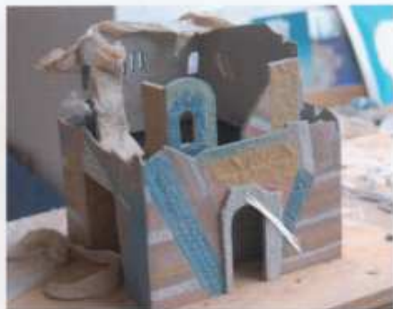
13. Zo bouw ik verder tot het totaal naar mijn zin is. Zodra het werk droog is, kleur ik het oppervlak waar nodig wat bij en werk (denk aan stofmasker!) het plaatselijk af met schuurpapier. Na de biscuutstook op 1000 °C kleur ik de binnenkant met pigmenten en breng met de spuit glazuur aan. Dan stook ik nog een keer op 1120 °C.